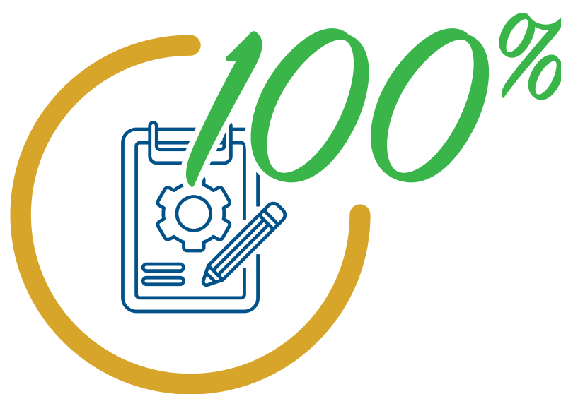
Demande de propositions HIVER 2021-22