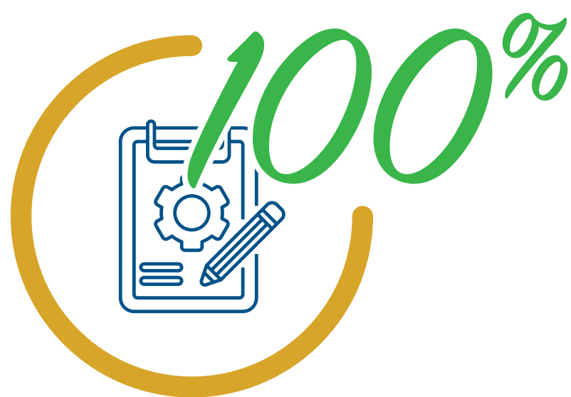
Demande d'offre AUTOMNE 2021

Les dates prévues liées aux activités précédentes peuvent être affectées par des retards dans le processus d'approbation. Pont de la rivière Kouchibouguac Le ministère des Transports et de l'Infrastructure construira un nouveau pont de 95 mètres au même endroit que le pont précédent, qui a été construite en 1963. La circulation sera détournée pendant la construction.