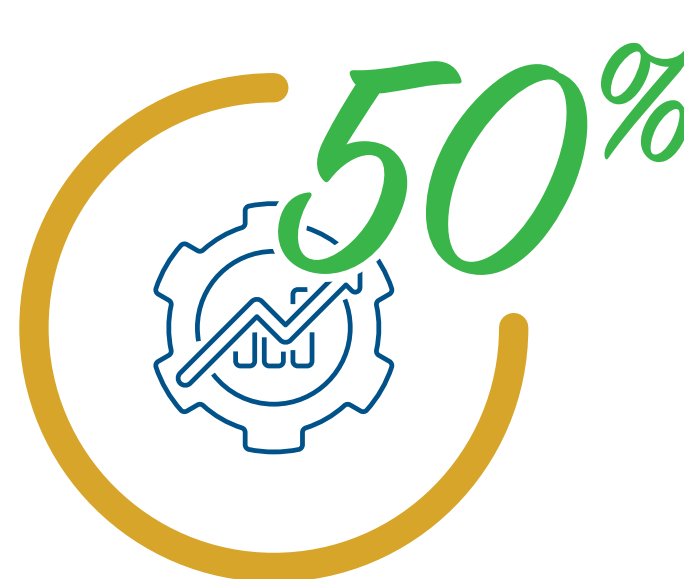
Avancement du projet EN COURS DE RÉALISATION