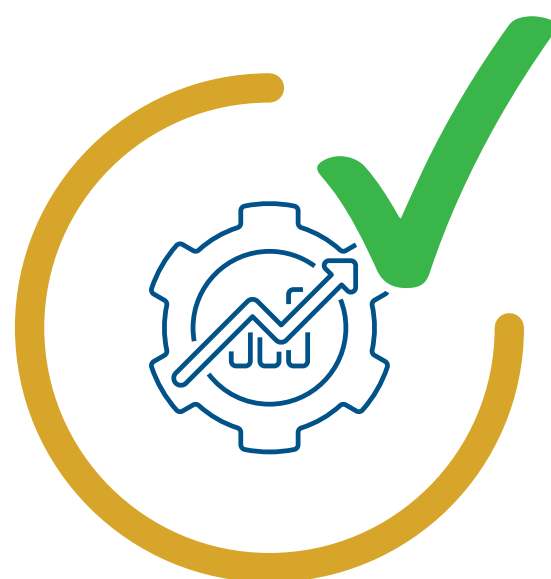
Début du chantier ÉTÉ 2022