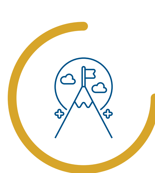
Achèvement du chantier AUTOMNE 2023